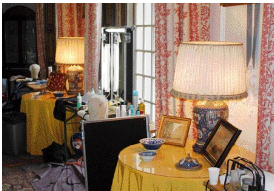
De geïmproviseerde make-upafels.