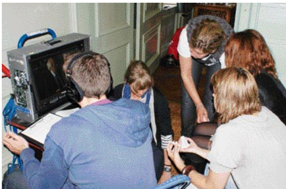
Op het scherm wordt meegekeken of er nog moet worden bijgeschminkt.